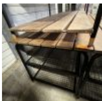
Table de présentation 3 niveaux (2 plateaux grillagés, 1 plateau bois) (longueur environ 2m) Mise à prix : 80€ Suite LJ SARL BB2 (BLUE BOX), à la requête du TC de RENNES, Me THIRION Charlotte, MJ