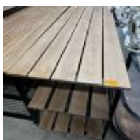
Table de présentation 3 niveaux (3 plateaux bois) (longueur environ 2m) Mise à prix : 80€ Suite LJ SARL BB2 (BLUE BOX), à la requête du TC de RENNES, Me THIRION Charlotte, MJ