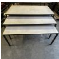
Table de présentation 3 niveaux ( 3 plateaux bois) (longueur environ 2m) Mise à prix : 80€ Suite LJ SARL BB2 (BLUE BOX), à la requête du TC de RENNES, Me THIRION Charlotte, MJ