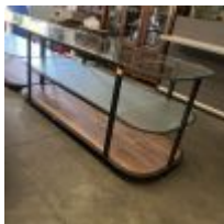
Table de présentation structure en métal 3 niveaux : 2 plateaux verre, 1 plateau bois (longueur environ 2m) Mise à prix : 100€ Suite LJ SARL BB2 (BLUE BOX), à la requête du TC de RENNES, Me THIRION Charlotte, MJ