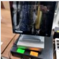
Lot n° 6 Système de caisse avec écran tactile avec affichage client APEXA 9.7, avec imprimante ticket ALTIS, balance PPZT NB0122, tiroir caisse, douchette JDC, multiprise onduleur LEGRAND Mise à prix : 150€ Suite LJS SAS MAISON VRAC, à la requête du TC de RENNES, Me BRILLAUD Benjamin, MJ