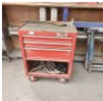
Table sur roulette garnie d'outils à main : clés, tournevis, 4 outils pneumatiques Mise à prix : 80€